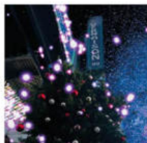
@nogallery93. Vue de nuit du marché Vernaison.

Faites-nous parvenir vos photos sur Instagram avec le hashtag #sosaintouen