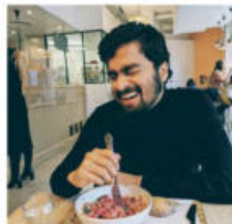
@adhithyavchotu. Pause déj chez Anima.