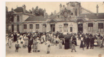
L'école du Centre devient école Jean-Jaurès après 1918 puis en partie collège en 1969. Ici, vers 1900.