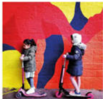
@colsonagathe. Initiation à l'art urbain avec la fresque d'Arts.