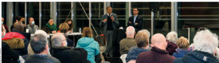
Présentation du projet de rénovation du Vieux Saint-Ouen à la Serre du Grand Parc.

D'ici 2030, les deux quartiers vont faire l'objet d'un grand programme d'embellissement, de végétalisation et de rénovation.