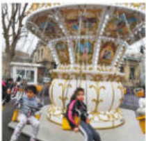
@tiphainecariou. Manège du Village d'hiver pour les fêtes!