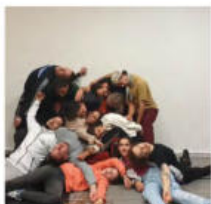
@virgilamour. Atelier de danse à Mains d'Œuvres.