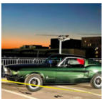
La légendaire Ford Mustang de Steve McQueen lors d'un tournage audonien.