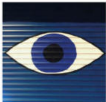
@kimonokro. Street art aux Puces.