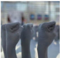
@tgaparis. L'œuvre de Louka Anagyros à la Biennale de Panama.