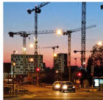
@tj169. Promenade nocturne boulevard Victor-Hugo.